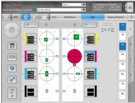
套准导引系统运行屏幕报纸