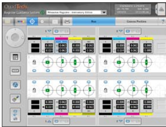
套准引导系统运行屏商用